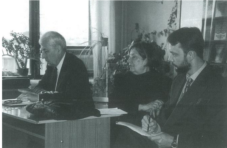
Université Dobrolioubov, Nijni-Novgorod