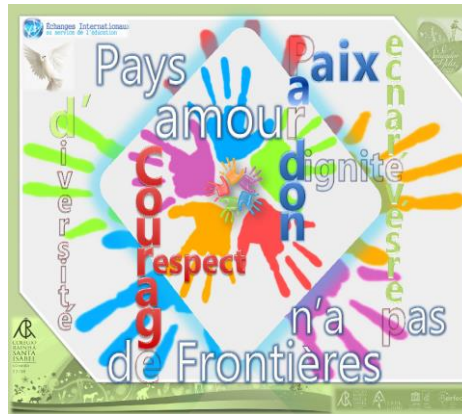
Affiche réalisée par la délégation portugaise pour la rencontre.